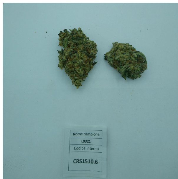
CAMPIONE ANALIZZATO: Finola(3.00gr)