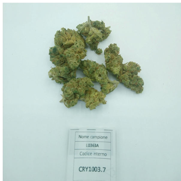
CAMPIONE ANALIZZATO: Finola(3.00gr)