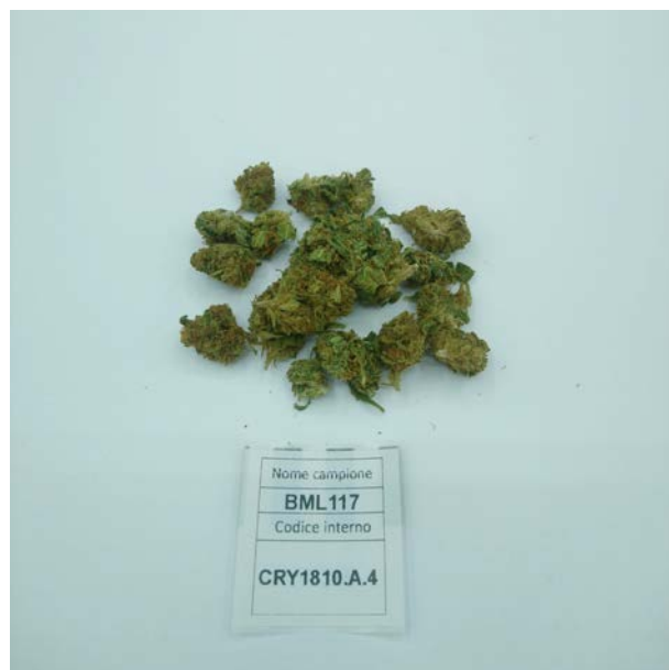
CAMPIONE ANALIZZATO: Finola(3.00gr)